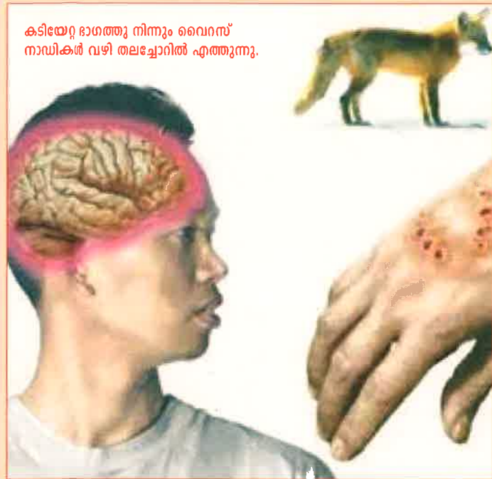
കടിയേറ്റ ഭാഗത്തു നിന്നും വൈറസ് നാഡികൾ വഴി തലച്ചോറിൽ എത്തുന്നു.

മൃഗങ്ങളിൽ നിന്ന് മനുഷ്യരിലേക്ക് പകരുന്ന മാരകമായ ഒരു വൈറസ് രോഗമാണ് പേവിഷബാധ. രോഗത്തിന് കാരണമാകുന്ന റാബ്ഡോ വൈറസ് നാഡീവ്യൂഹത്തെയാണ് ബാധിക്കുന്നത്. നായ്ക്കളാണ് രോഗം പടർത്തുന്നതിൽ പ്രധാനി. എന്നാൽ പൂച്ച, ചെന്നായ്, കീരി എന്നിവയും അപകടകാരികളാണ്. രോഗലക്ഷണം പ്രകടമായിക്കഴിഞ്ഞാൽ മരണം ഉറപ്പാണ്. ഇന്ത്യയിൽ പ്രതിവർഷം ഏകദേശം 20,000 ആളുകൾ പേവിഷബാധയേറ്റ് മരിക്കുന്നു.